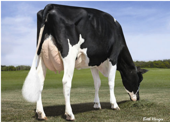
KELLERCREST MANOMAN LACY Dam